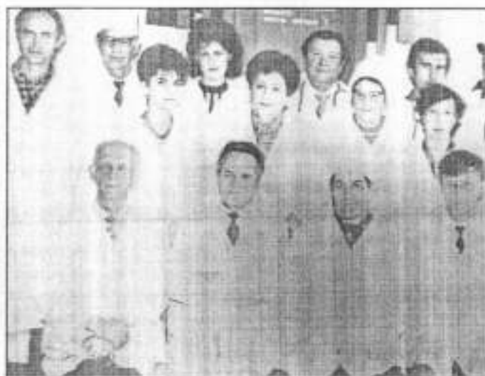
Колектив кафедри госпітальної терапії у 1988 та 1994 рр.