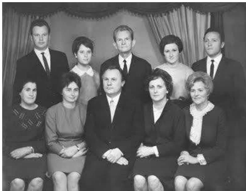
Колектив кафедри фармакології з курсом токсикології ЧМІ на чолі з професором Г.Т. Пісько (в центрі) 1970 р.

нових антимікробних речовин у ряді четвертинних амонієвих сполук, проводив пошук лікарських засобів серед сполук нового синтезу. Поряд з основною роботою на кафедрі Г.Т. Пісько виконував обов'язки завідувача відділу аспірантури, заступника декана та декана (1967 – 1970 рр.) лікувального факультету інституту.