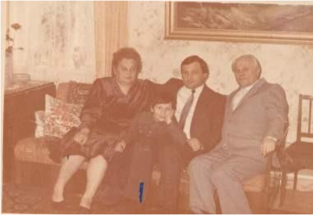
З сином Георгієм та онуком