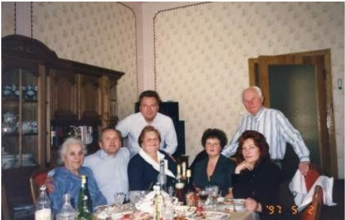
В родинному колі з нагоди святкування дня народження дружини (02.05.1997 р.)