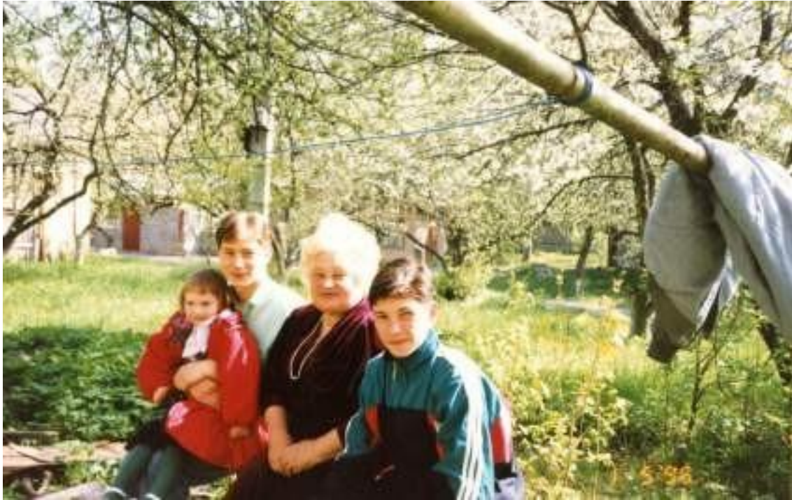
З дружиною та онуками